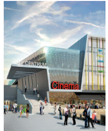
Illustration: Täby Centrums webbsajt

Utbyggnad på gång: Unibail-Rodamcos utvidgning och omdaning av Täby Centrum verkar inte hindras av lågkonjunkturen.