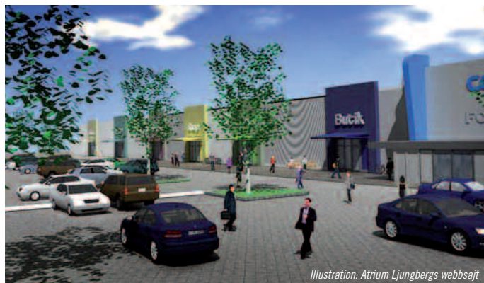
Vilande: Atrium Ljungbergs utveckling av Botkyrka Handel i Fittja är ett exempel på projekt som har lagts på is. Här finns 8 000 m 2 handelsyta, men intressenter saknas.